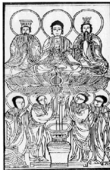
Tam giáo Tổ sư, Tam giáo kinh (bản khắc của Việt Nam)

Bên dưới là một bình hương nghi ngút. Khổng, Lão mà ngồi tòa sen, người Việt Nam nghĩ ra được hình tượng ấy mới là độc đáo.